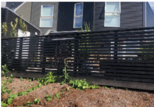
Eksempel på rekkverk med toppbord i tre.