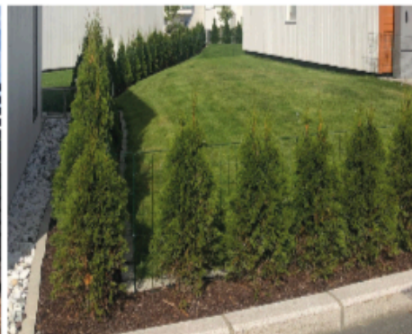
Eksempel på flettverksgjerde i kombinasjon med vegetasjon.

Levegger skal utformes med liggende eller stående kledning, og skal ha samme farge som på bolig. Toppbord skal være aluminiumsbeslag tilsvarende bolig. Levegger kan bygges inntil 2 meter ut fra bolig, med en maks høyde på 1,50 m. Levegg fra bod mot gatetun kan ha en maks høyde på 1 meter.