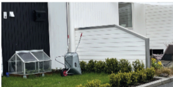
Eksempel på levegg med liggende kledning og toppbord i aluminiumsbeslag.