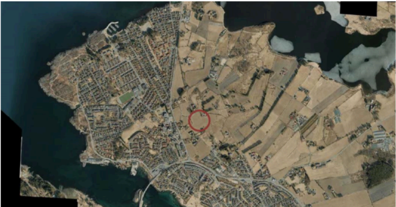
Figur 1 - Planområdet lokasjon. Planområdet er markert med rødt.

Planområdet ligger på Nore Sunde i Madla bydel, omtrent 300 m øst for Kverntorget/Kvernevik sentrum. Planområdets flatemål er omtrent 27,2 daa. Planområdet er ferdig utbygd iht. reguleringsplan.