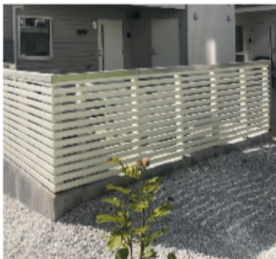
Eksempel på rekkverk med toppbord i aluminiumsbeslag.