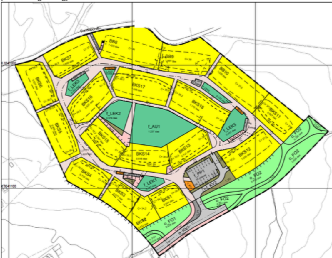
Figur 3 - Plankart, gjeldene regulering

Gjeldene reguleringsplan for området er «Detaljregulering for felt B2, Nore Sunde», som ble vedtatt i 2015. Hensikten med planen er å tilrettelegge for boligbebyggelse i form av rekkehus og blokkbebyggelse, med tilhørende sandlekeplasser og felles uteoppholdsareal. Planområdet inngår i reguleringsplan (områderegulering) 2325 for Nore Sunde.