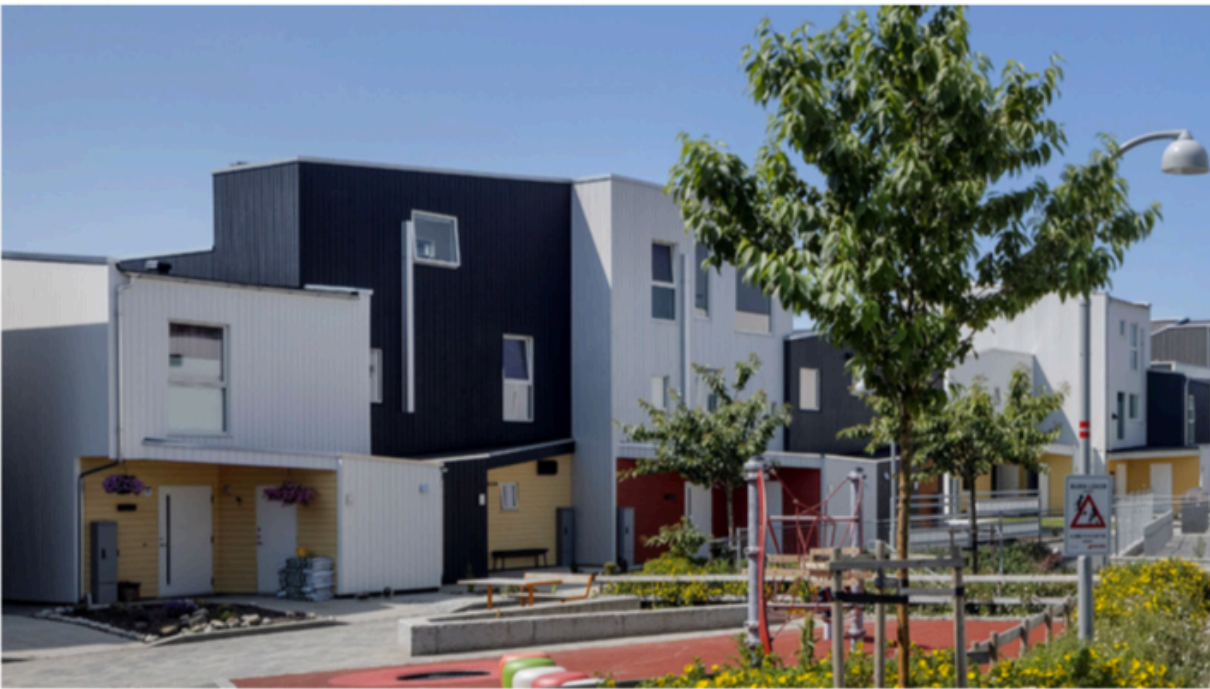
Figur 2 - Bilde fra bebyggelse innenfor planområdet